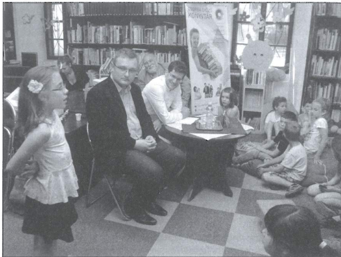
A Négy kicsi cica könyvbemutatóján

Az év során megjelentettük a költő Négy kicsi cica című könyvének hasonmás kiadványát. A gyerekeknek szóló verses képeskönyvet eddig jobbára csak a szerző lányai, unokái ismerhették. A könyvritkaság újrakiadása a költő-apa gyerekbarát, vidám arcát is megmutatja.