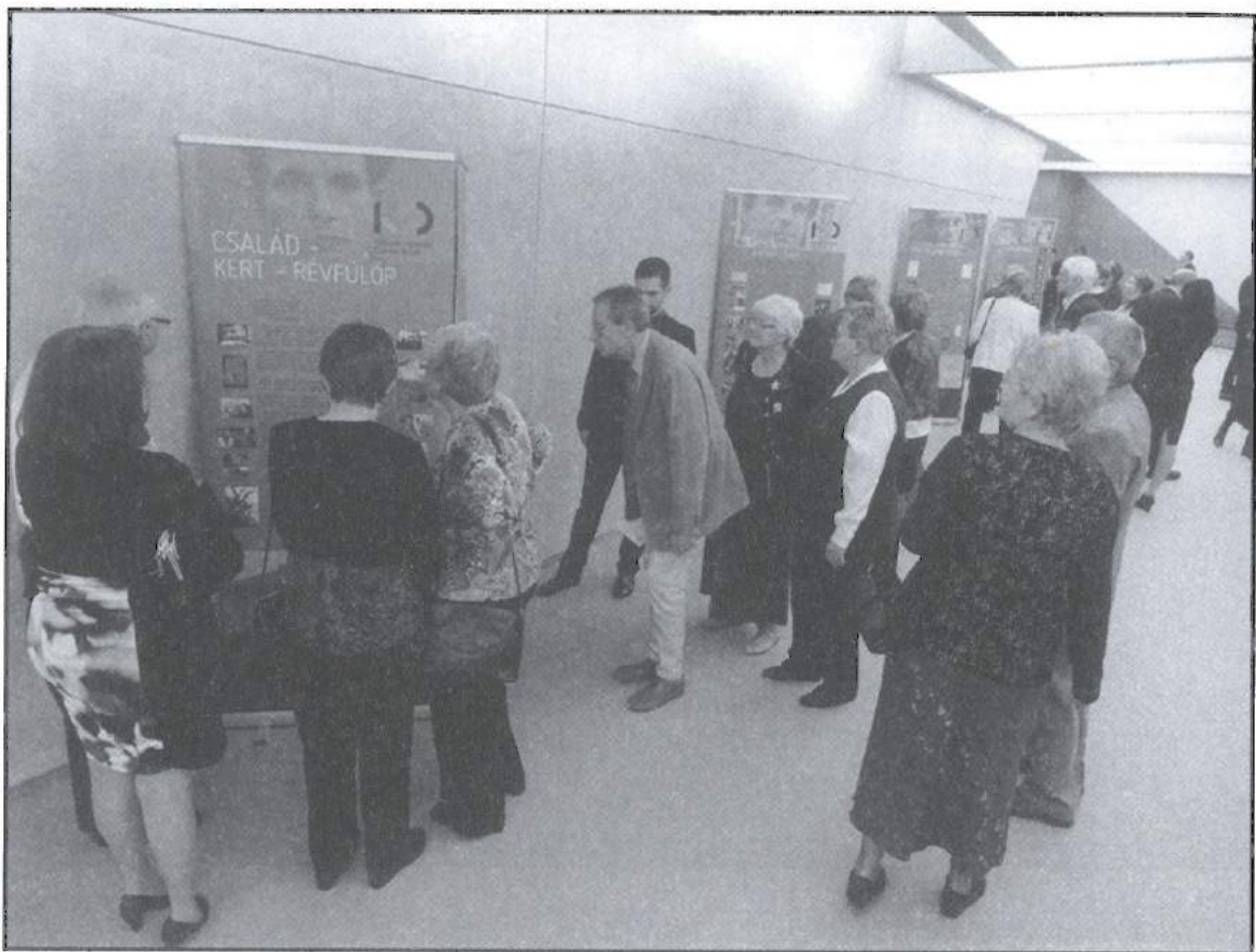
Vándorkiállítás a Kodály Központban

A műveket 2016. november 23-án mutatták be a jeles év záróeseményén, a költő tiszteletére rendezett emlékkoncerten a pécsi Kodály Központban. A koncert szüneteiben a nézőket könyvcseré és a vándorkiállításunk várta, az aulában pedig megtekinthették a Csorba Győző emlékszoba berendezését.